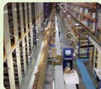
Vatry - Stock de pièces détachées

50 techniciens Air Liquide Welding à votre service partout en France